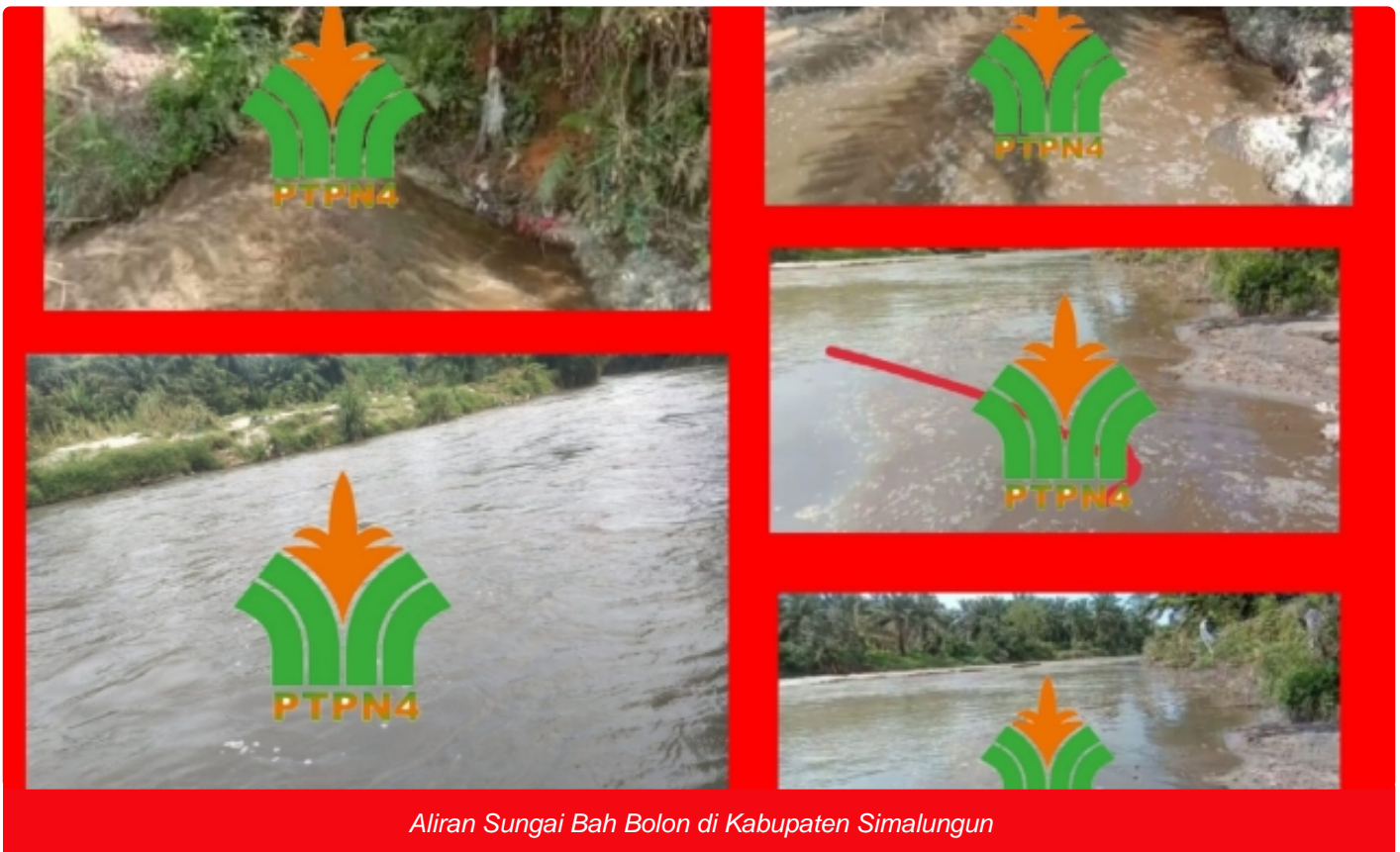
Aliran Sungai Bah Bolon di Kabupaten Simalungun

SIMALUNGUN- Kalangan masyarakat menuding asal usul Limbah Cair Pabrik Kelapa Sawit (LCPKS ; red) atau biasa disebut Palm Oil Mill Effluent (POME ; red) berasal dari Instalasi Limbah Pengolahan Air Limbah (IPAL ; red) milik PTPN IV PKS Bah Jambi.